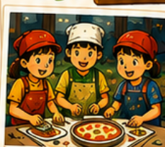
ピザ・カレー作り アウトドアクッキング