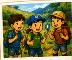
ネイチャー探検 & ゲーム