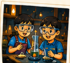
サイエンス実験 & チャレンジ