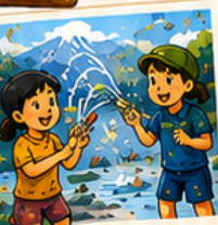
ウォーターアクティビティ & 水あそび