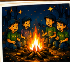
キャンプファイヤー & ナイトアクティビティ