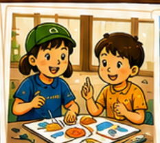
クラフト・アート 手作り体験