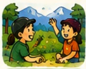
ネイチャーゲーム