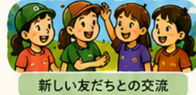
新しい友だちとの交流