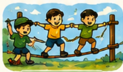
チームチャレンジ