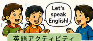
英語アクティビティ